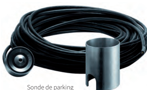
Sonde de parking