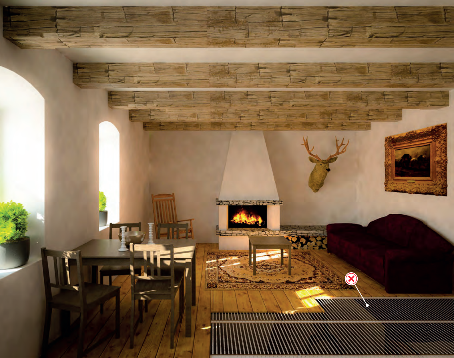
SCHÉMA DE COUPE DU DYNASOL