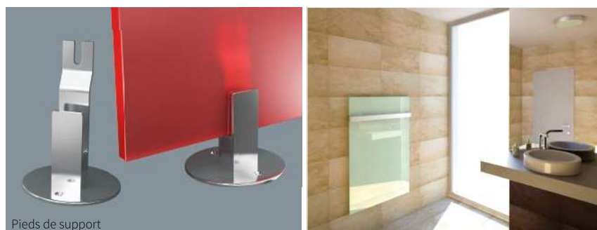
Pieds de support

▷ 230V ; IP 44 ; Profondeur d'inst. : 61 mm ; Conforme aux normes EN 50366 / 55014 / 61000