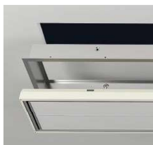
Cadre encastrable faux-plafond