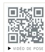
▶ VIDÉO DE POSE